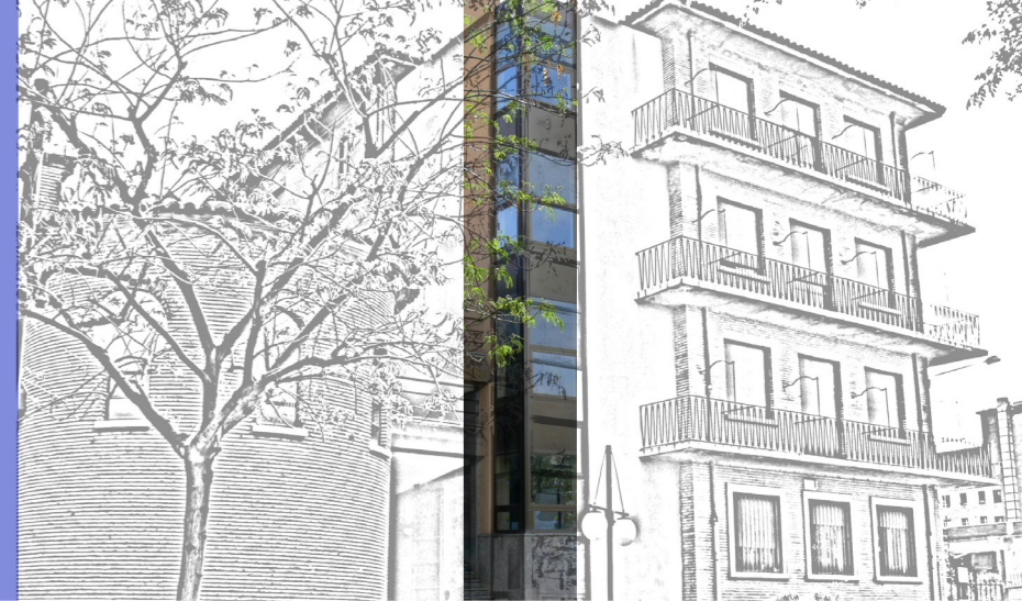
Residencias Instituto Aragonés de la Juventud