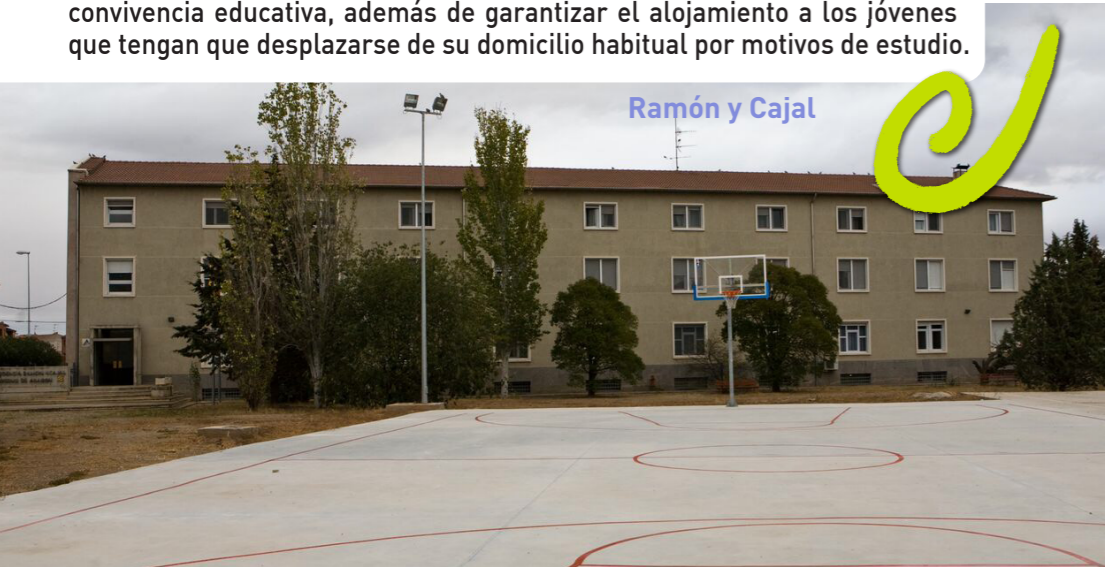
Ramón y Cajal

Las residencias juveniles del Instituto Aragonés de la Juventud, ubicadas en Zaragoza y La Almunia de D a Godina, son centros encaminados a lograr el pleno desarrollo de la personalidad del joven mediante un sistema de convivencia educativa, además de garantizar el alojamiento a los jóvenes que tengan que desplazarse de su domicilio habitual por motivos de estudio.